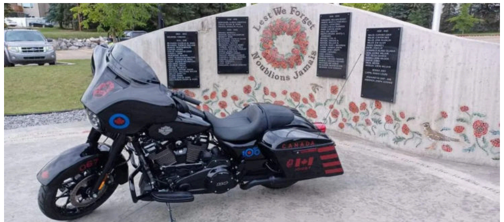
A retired pilot from No.414 (EW) Squadron shows off the one-of-a-kind McDonnell EF101 Voodoo - the “Electric Voodoo,” Harley Davidson style. CanMilAir Decals