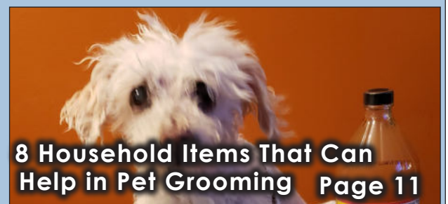
8 Household Items That Can Help in Pet Grooming Page 11